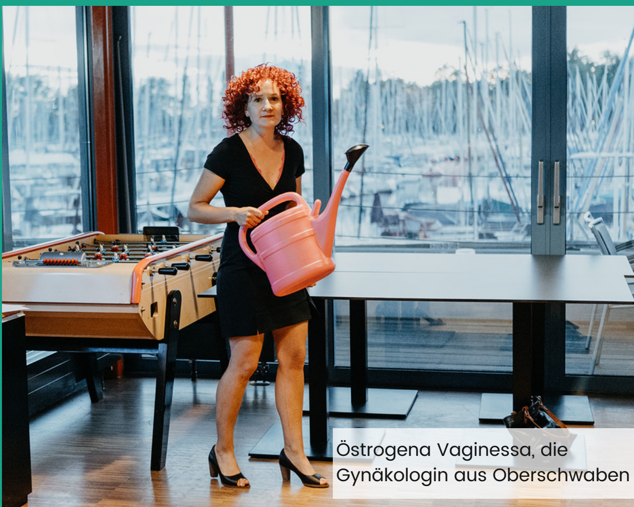
Östrogena Vaginessa, die Gynäkologin aus Oberschwaben