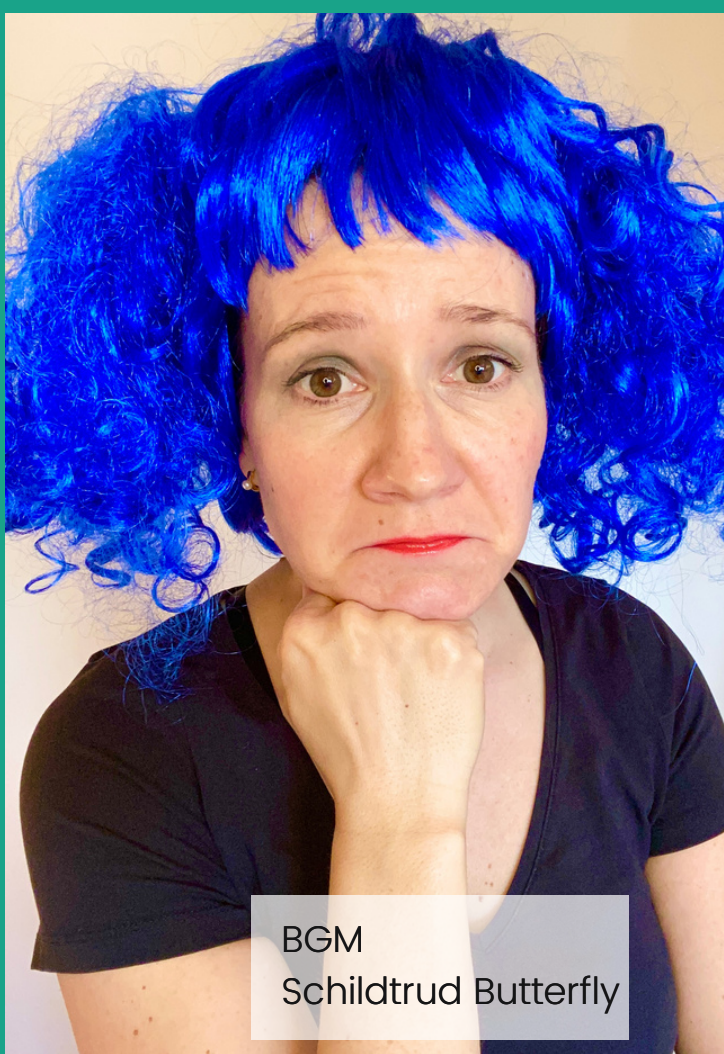
BGM Schildtrud Butterfly