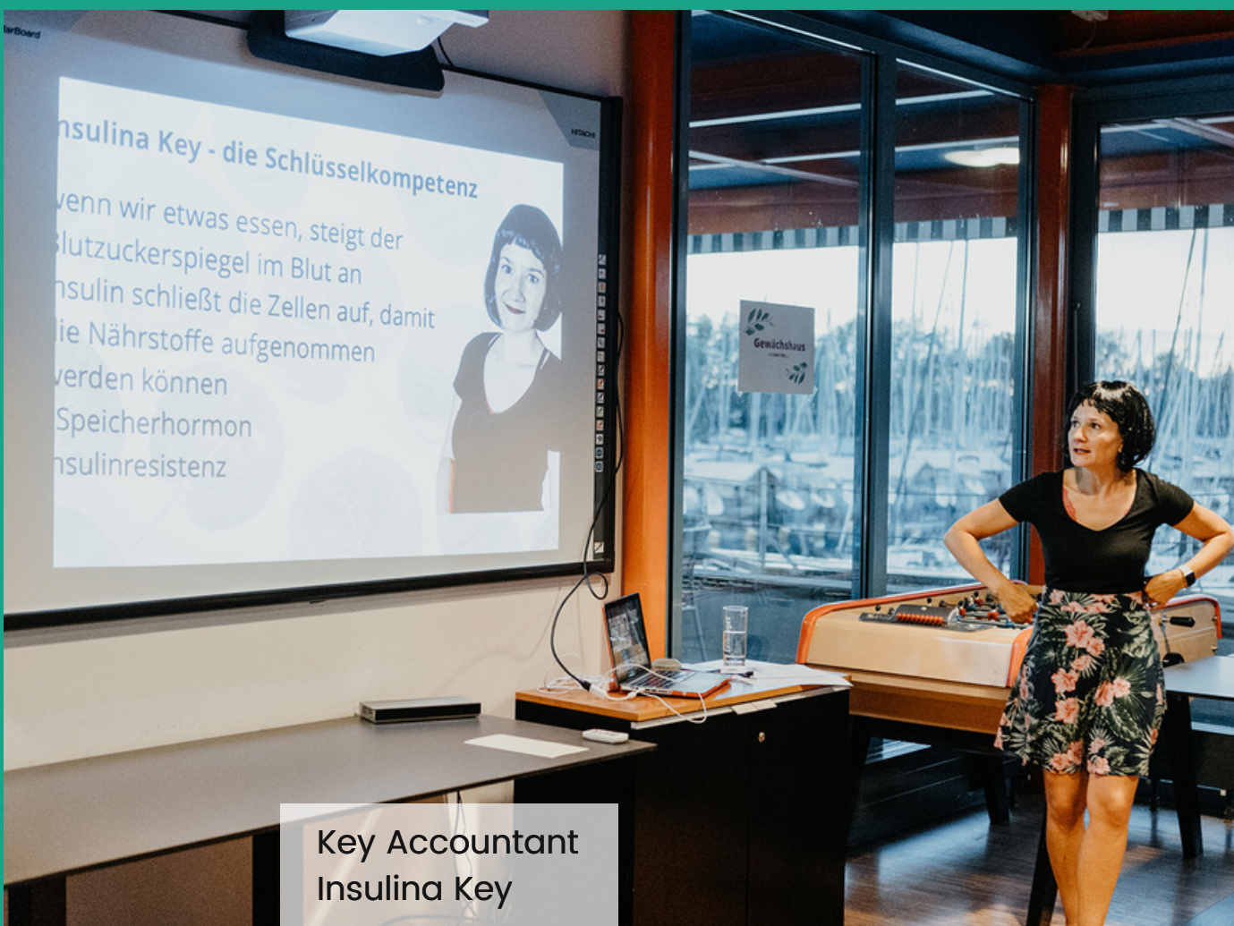
Key Accountant Insulina Key