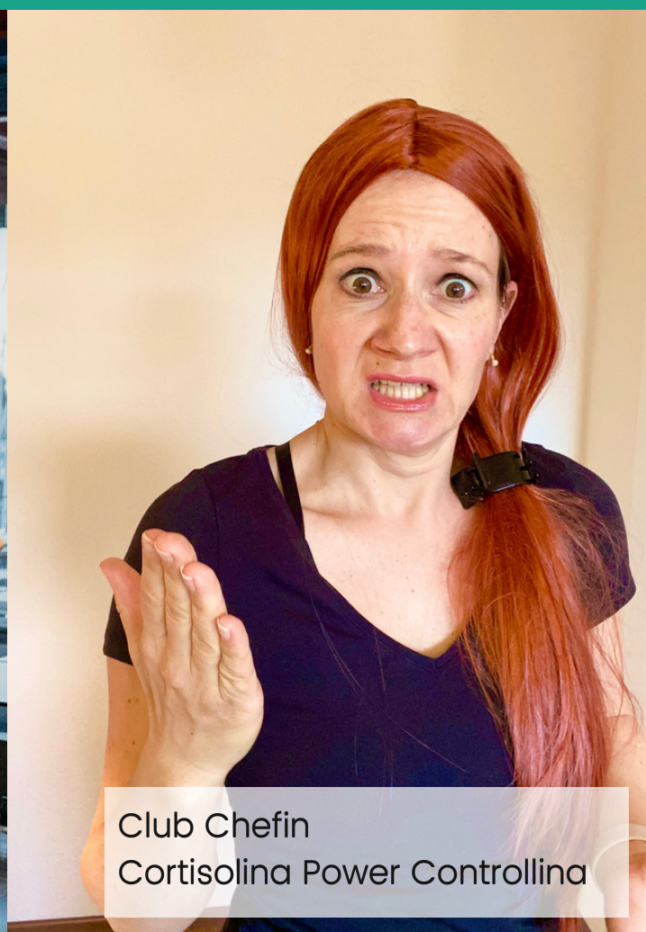
Club Chefin Cortisolina Power Controllina